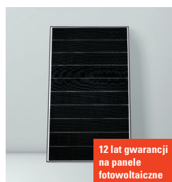
12 lat gwarancji na panele fotowoltaiczne

Nowe pompy ciepła typu Monoblok z temperaturą zasilania do 70°C są idealnym rozwiązaniem przy modernizacji gdyż pozwalają pozostawić istniejące grzejniki. System Hydro AutoControl umożliwia pracę z dowolnym systemem ogrzewania i chłodzenia płaszczyznowego bez stosowania zbiornika buforowego.