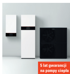
5 lat gwarancji na pompy ciepła

Nowe pompy ciepła typu Monoblok z temperaturą zasilania do 70°C są idealnym rozwiązaniem przy modernizacji gdyż pozwalają pozostawić istniejące grzejniki. System Hydro AutoControl umożliwia pracę z dowolnym systemem ogrzewania i chłodzenia płaszczyznowego bez stosowania zbiornika buforowego.