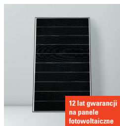
12 lat gwarancji na panele fotowoltaiczne

Nowe pompy ciepła typu Monoblok z temperaturą zasilania do 70°C są idealnym rozwiązaniem przy modernizacji gdyż pozwalają pozostawić istniejące grzejniki. System Hydro AutoControl umożliwia pracę z dowolnym systemem ogrzewania i chłodzenia płaszczyznowego bez stosowania zbiornika buforowego.