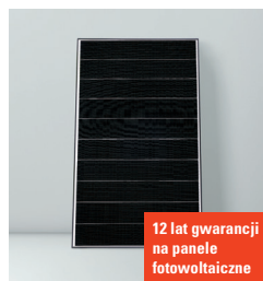
12 lat gwarancji na panele fotowoltaiczne

Nowe pompy ciepła typu Monoblok z temperaturą zasilania do 70°C są idealnym rozwiązaniem przy modernizacji gdyż pozwalają pozostawić istniejące grzejniki. System Hydro AutoControl umożliwia pracę z dowolnym systemem ogrzewania i chłodzenia płaszczyznowego bez stosowania zbiornika buforowego.