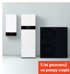
5 lat gwarancji na pompy ciepła

Nowe pompy ciepła typu Monoblok z temperaturą zasilania do 70°C są idealnym rozwiązaniem przy modernizacji gdyż pozwalają pozostawić istniejące grzejniki. System Hydro AutoControl umożliwia pracę z dowolnym systemem ogrzewania i chłodzenia płaszczyznowego bez stosowania zbiornika buforowego.